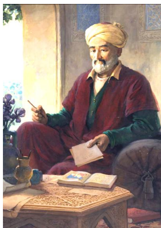
Рисунок 2 - В. Кайдалов. Алишер Навои, 1948 год

Работы художника В. Кайдалова занимают важное место в отражении образа исторических личностей. Его художественное мастерство выражается в созданных образах исторических личностей (Рисунок 2).