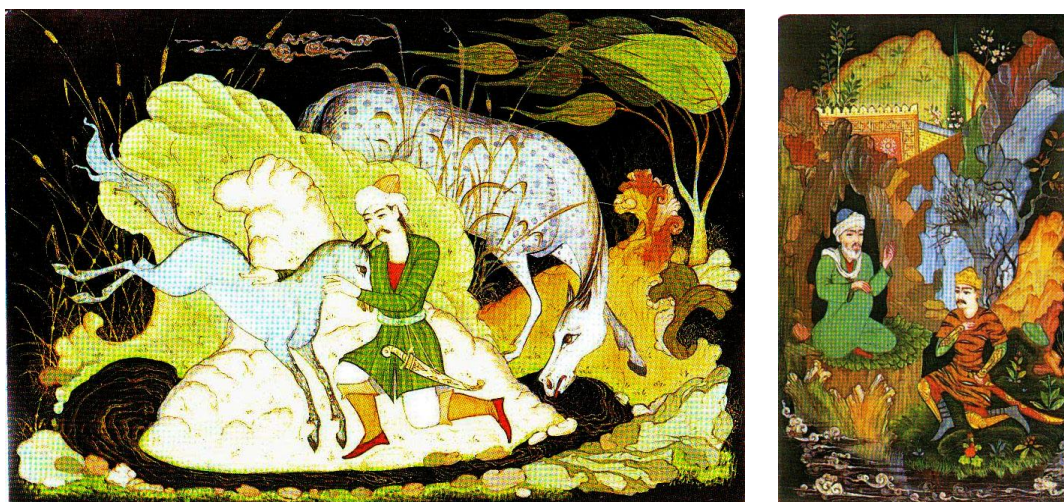
Рисунок 4 - Т. Болтабоев. Рисунок народного эпоса - Гуругли

И, наконец, после предыдущих процессов необходимо идеально проработать финальный сюжет. Завершающий этап творческого процесса — тщательная проверка работы с нуля, при которой некоторые места могут быть изменены, что-то останется вспомогательным материалом, что-то исключено. На этом этапе работу следует рассматривать в целом. Он знает, что сделать, чтобы завершить композицию, важность деталей (Рисунок 4).