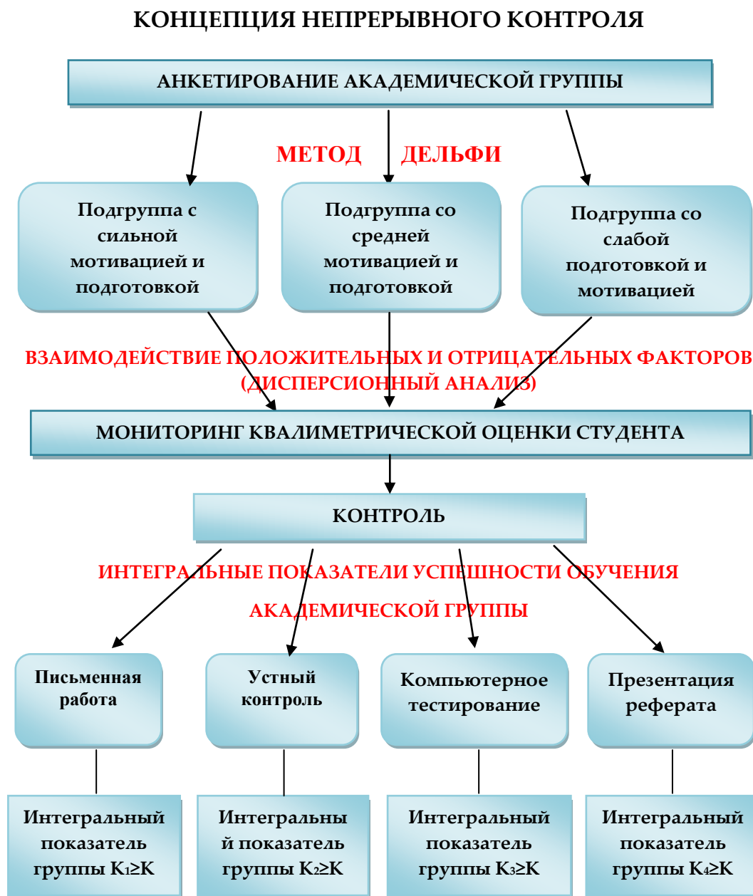
Рисунок 1 - Схема концепции