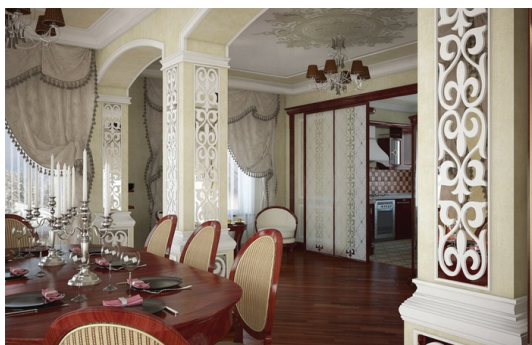
Сурет 2 - Қонақ бөлмесінің интерьері

Интерьердегі сары түс – спектрдегі ең ашық түс, күн сәулелі түс. Жайлылық атмосферасын беретін түс. Сары түсті балалар бөлмесінде көбірек қолданады, өйткені балалардың ойлау қабілетінің дамуына зор ықпалын тигізеді. Сондай-ақ жандандыратын түс, көңіл күйді көтеретін, ас қорытуды жақсартады, қимыл – қозғалысты жақсартады, адамды шаршатпайды. Сонымен қатар сары түс бөлмені кеңейтіп көрсетеді (Сурет 2).