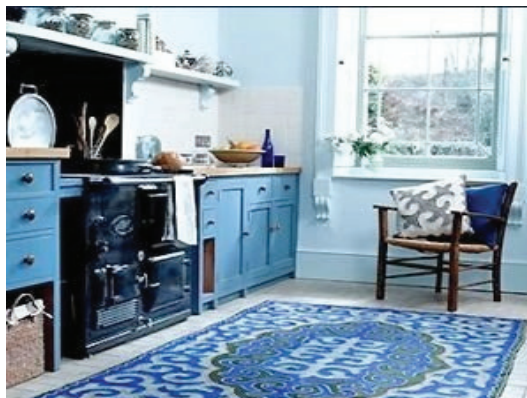
Сурет 4 - Көк түсті шешімдегі интерьер

Интерьердегі көгілдір түс- тыныштыратын түс, сергітетін, шыдамдылыққа баулитын, салқындатқыштық қасиеті бар. Бұл түс көк аспан, тұнық судың, қарлы шыңның түсі. Бұл түсті көбіне жұмыс орындарына қолданады. Бұл түстегі интерьер кең болып көрінеді (Сурет 4 ).