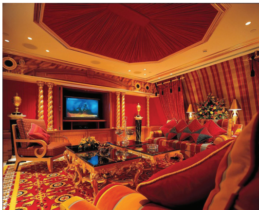
Сурет 1 - Қызыл түсті шешімдегі интерьер

Сонымен қатар көру мүшесі арқылы қабылданып, адам ағзасының барлық мүшелерінің жұмысын жандандырады (Сурет 1).