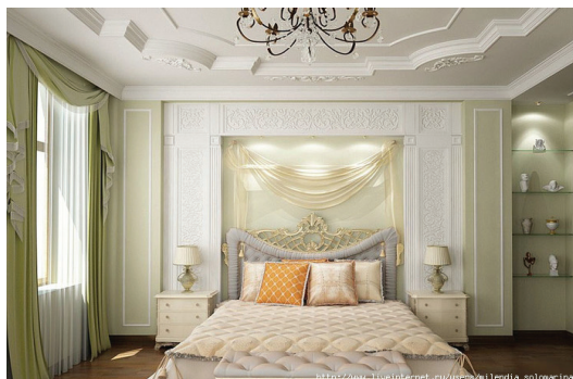
Сурет 3 - Ашық түстегі жатын бөлмесі

қиыншылықтарға қарсы тұратын қасиетке ие. Жасылға жақын түстердің барлығы да жеңіл және қуанышты атмосфераны, көтеріңкі көңіл-күй беріп тұрады (Сурет 3).