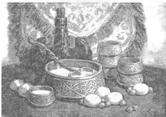
Рисунок 1 - Орнамент на домашней утвари

И очень важно, что культурное наследие дошло до наших времен. И сейчас, мы широко применяем национальные орнаменты, элементы казахских узоров, петроглифы. Орнамент применяется в архитектурных сооружениях в качестве элемента композиции и средства художественной выразительности. В архитектуре различных стилей, различных эпох орнамент используется различно. Роль его в архитектурной композиции и его формы при этом существенно меняются [2] (рис.1).