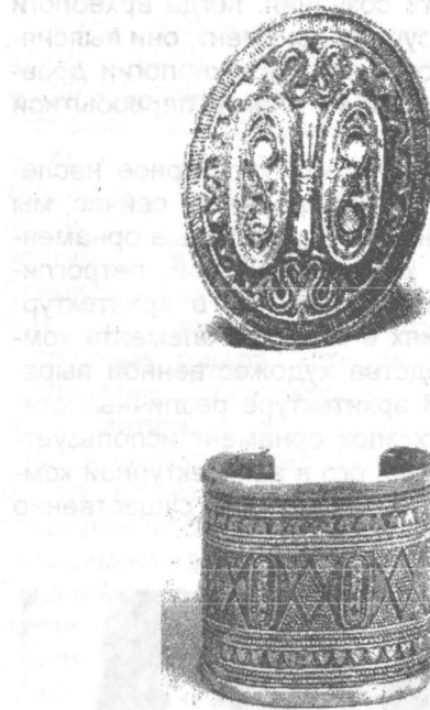
Рисунок 3 - Орнамент в национальной одежде, в ювелирном искусстве Пазырыкских курганов

В решении вопросов декоративного украшения того или иного сооружения, вне зависимости от назначения, мастера обращались к неиссякаемому роднику формотворчества - к народному искусству, вводя в архитектурный декор памятника мотивы, поныне живущие в украшениях быта и одежды (рис.3). Орнаментальный декор в синтезе с архитектурными формами подчер-