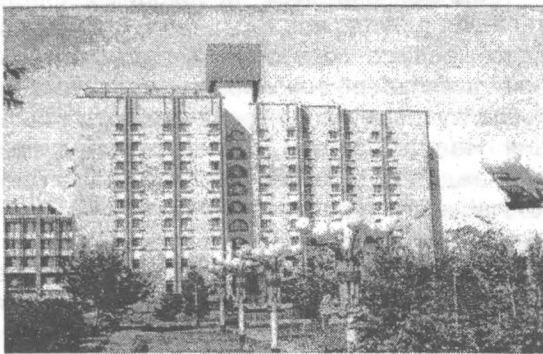
Рисунок 1 - Здание гостиницы «Турист» (ныне «Абай»)

трии наряду с панельными, блочными и кирпичными домами стали возводиться дома с использованием технологии монолитной опалубки. Наряду с прямоугольными формами, характерные для панельного домостроения стали проектироваться здания с круглыми очертаниями в плане. Местными архитекторами были построены в городе здания общественного назначения, имеющие своеобразный архитектурный облик: Дворец молодежи (арх. А. Полянский), Дворец торжественных обрядов (снесен в 2003 г.; арх. В. Драгун, В. Тоскин, Е. Погуца), Дворец пионеров (ныне Дворец творчества детей и юношества) (арх. В. Тоскин, В. Корнилов, Е. Погуца, В. Гладких), гостиница «Турист» (ныне гост. имени Абая) (арх. В. Тоскин, Корнилов, Е. Погуца, А. Башимов), рис. 1.